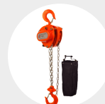
PALANS MANUELS À CHAÎNE SÉRIE 630