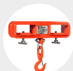
CROCHET DE LEVAGE POUR CHARIOT ÉLEVATEUR MODÈLE UCAR