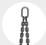
LINGA "DO" Pág. 84