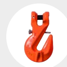
GANCHO ENCURTADOR COM TRINCO LIGAÇÃO DIRETA MODELO G.80 Pág. 81