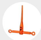
TENSOR DE CATRACA PINOS MODELO ATC Pág. 98