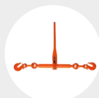
TENSOR DA CATRACA COM GANCHOS MODELO PTG Pág. 98