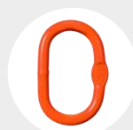
ARGOLA OVALADA Pág. 78