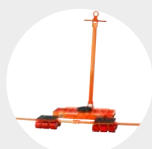
TANQUETAS DE TRANSPORTE MODELO ATACA Pág. 68