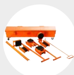
KIT DE TANQUETAS MODELO AKT Pág. 69