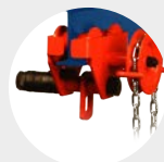
CARRO TIPO A SÉRIE 500 Pág. 22