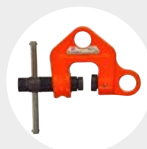
GRIFFE À POUTRELLE MODELO WF Pág. 49