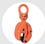
GARRAS ARTICULADAS MÓDELO BT Pág. 46