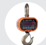
GANCHO DE PESAGEM MÓDELO GPJ Pág. 73