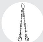
LINGA "DOL" Pág. 84