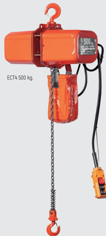
ECT4 500 kg.