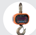
GANCHO DE PESAGEM MODELO GPJ Pág. 73