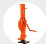
MACACOS CREMALHEIRA MODELO GC Pág. 66