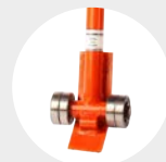
ALAVANCA DE ELEVAÇÃO MODELO APAEL Pág. 70