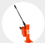
MACACO HIDRÁULICO DE UNHA MODELO AGATU Pág. 67