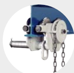
CARROS PORTA-POLIAS INOXIDÁVEL SÉRIE 580 AC Pág. 32