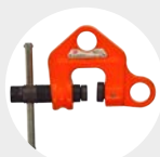
GARRA DE PARAFUSO MODELO WC Pág. 49