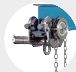
CARROS PORTA-POLIAS INOXIDÁVEL SÉRIE 570I