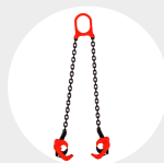
ÉLINGUES DE LEVAGE POUR BARILS MODÈLE GABID Pag. 60