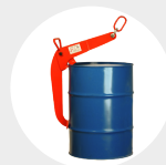
PINCES DE LEVAGE POUR BARILS MODÈLE PBID Pag. 58