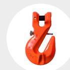
CROCHET À CHAPE AVEC BOULON MODÈLE G.80 Pag. 81