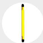
ÉLINGUES SANGLE Pag. 94