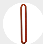
ÉLINGUES ROND Pag. 95