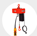
PALANS À CHAÎNE ÉLECTRIQUES MONOPHASES MODÈLE COMPACT Pag. 125