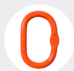
ANNEAU OVALE Pag. 78