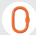
MAILLON PRINCIPAL Pág. 78