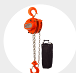
PALAN À CHAÎNE MANUEL SÉRIE 630 Pag. 20