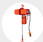
PALANS À CHAÎNE ÉLECTRIQUE À UNE VITESSE MODÈLE EC4 Pag. 116