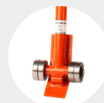
LEVIER DE LEVAGE MODÈLE APAEL Pag. 70