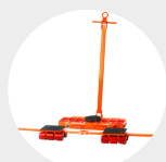
CHARIOTS À PATINS À ROULETTES MODÈLE ATACA Pag. 68