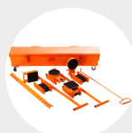
KITS DE CHARIOT MODÈLE AKT Pag. 69