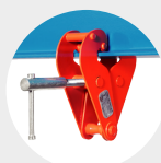
PINCÉS D'ACCROCHAGE MODÈLE BC Pag. 25