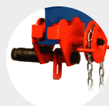
CHARIOT TYPE A SÉRIE 500 Pag. 22