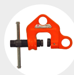
GRIFFE À POUTRELLE MODELE WF Pag. 49