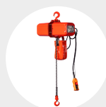
CHAÎNE TRIPHASÉE MODÈLE EC4 Pag. 116