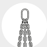
ÉLINGUE "TO" Pag. 85