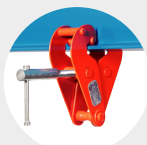
SERRE-POUTRES MODÈLE BC Pag. 25