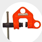
PINCÉS À VISSER MODÈLE WC Pag. 49