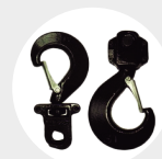
CROCHET DE LEVAGE À OËIL ACIER