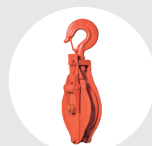
PASTECAS BISAGRA MODELO PBG Pág. 38