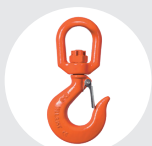
GANCHO CON PESTILLO GIRATORIO Pág. 82