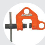
GARRA DE HUSILLO MODELO WF Pág. 51