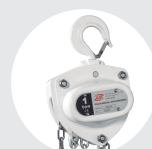
POLIPASTOS DE CADENA ANTICORROSIÓN SERIE 680 AC