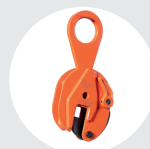
GARRAS FIJAS MODELO B Pág. 49