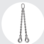
ESLINGA "DOL" Pág. 86