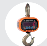
GANCHO PESADOR MODELO GPJ Pág. 75