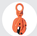
GARRAS ARTICULADAS MODELO BT Pág. 48