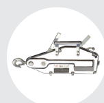
TIRADOR DE CABLE ACERO MODELO TCH Pág. 37