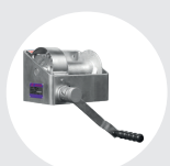
TORNOS MURALES MODELO TA Pág. 44