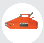
TIRADOR DE CABLE ALUMINIO MODELO TCAL Pág. 36