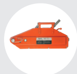
TIRADOR DE CABLE ALUMINIO MODELO TCAL Pág. 36