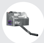
TORNOS MURALES MODELO TA Pág. 44