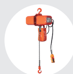
CADENA TRIFÁSICO MODELO EC4 Pág. 118