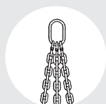
ESLINGA "TO" Pág. 87