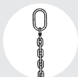
ESLINGA "SO" Pág. 86