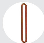
ESLINGAS REDONDAS Pág. 97