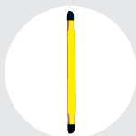
ESLINGAS PLANAS Pág. 96