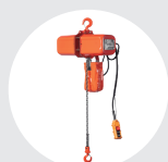
POLIPASTO ELÉCTRICO MODELO EC4 Pág. 118