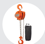
POLEAS MANUALES SERIE 630 Pág. 20