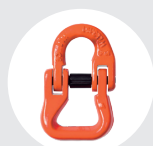
CONECTOR POLIÉSTER Pág. 81