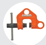
GARRA DE HUSILLO MODELO WF Pág. 51