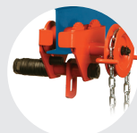
CARRO TIPO A SERIE 500 Pág. 22