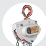
POLEAS MANUALES DE CADENA ANTICHISPA SERIE 690 AT