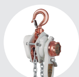
POLIPASTOS DE PALANCA ANTICHISPA SERIE 990 AT