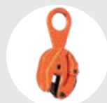
GARRAS FIJAS MODELO B Pág. 37