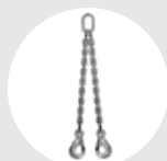
ESLINGA "DOL" Pág. 80