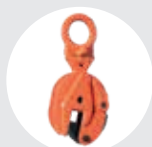
GARRAS ARTICULADAS MODELO BT Pág. 36