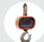
GANCHO PESADOR MODELO GPJ Pág. 70