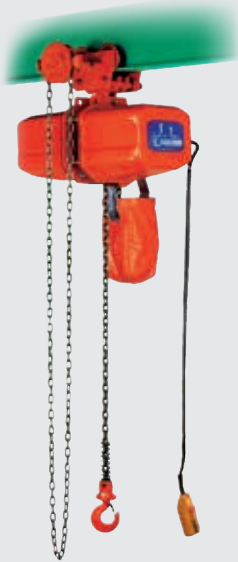
ECG4-ECTG4 1 Ton.