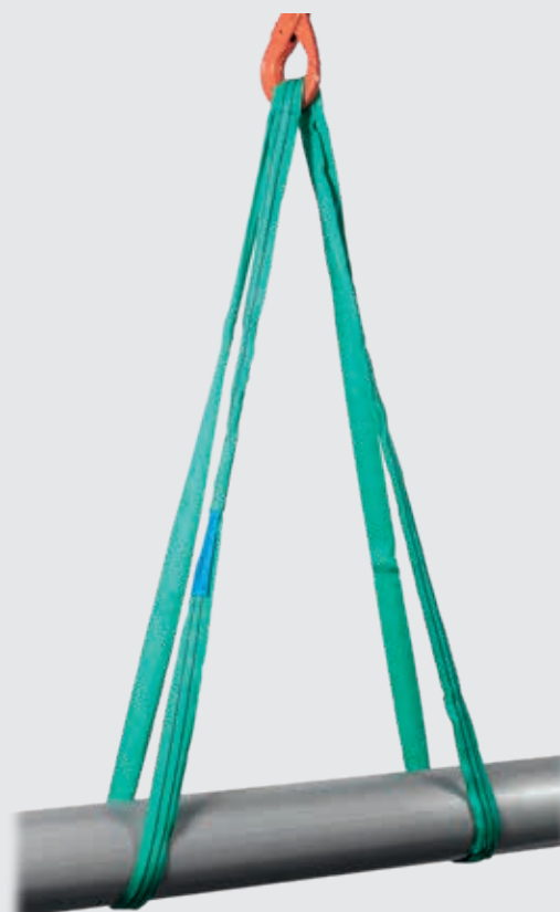
CARGA MÁXIMA DE UTILIZACIÓN (C.M.U.) KGS.