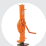
GATOS CREMALLERA MODELO GC Pág. 62