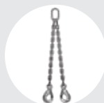
ESLINGA "DOL" Pág. 80