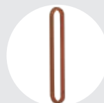
ESLINGAS REDONDAS Pág. 91