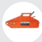
TIRADOR DE CABLE ALUMINIO MODELO TCAL Pág. 28