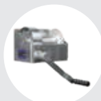
TORNOS MURALES MODELO TA Pág. 60