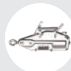
TIRADOR DE CABLE ACERO MODELO TCH Pág. 29