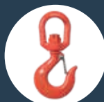
GANCHO CON PESTILLO GIRATORIO Pág. 76