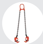
GARRAS PARA BIDÕES MODELO GABID Pág. 50