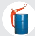
PINZAS PARA BIDÕES MODELO PBID Pág. 48