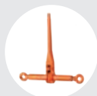
TENDEUR À CLIQUET AVEC BOULON À ŒIL MODÈLE ATC Pag. 52