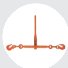
TENDEUR À CLIQUET AVEC CROCHETS MODÈLE PTG Pag. 52