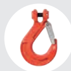
CROCHET AVEC LE LOQUET DE CONNEXION DIRECTE Modèle G.80 Pag. 75