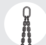
ÉLINGUE "DO" Pag. 80