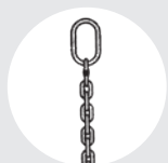
LINGA "SO" Pág. 80