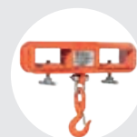
CROCHET DE LEVAGE POUR CHARIOT MODÈLE UCAR Pag. 56