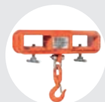
ÚTIL CARRINHOS MODELO UCAR Pág. 56