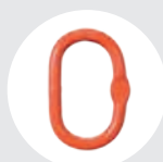
ARGOLA OVALADA Pág. 74