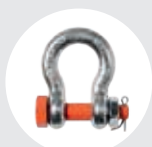
MANILHAS Pág. 94