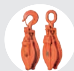
TALHAS COM DOBRADIÇA MODELO PBG / PBC Pág. 30