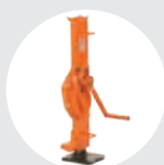
CRIC À CRÉMAILLÈRE MODÈLE GC Pag. 62