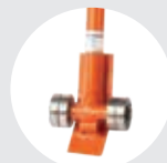
ALAVANCA DE ELEVAÇÃO MODELO APAEL Pág. 67